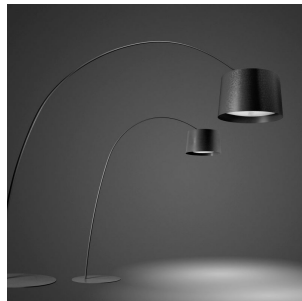
Twice as Twiggy