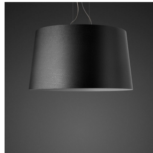
Twice as Twiggy