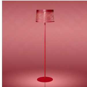
Twiggy Grid Lettura