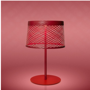
Twiggy Grid XL